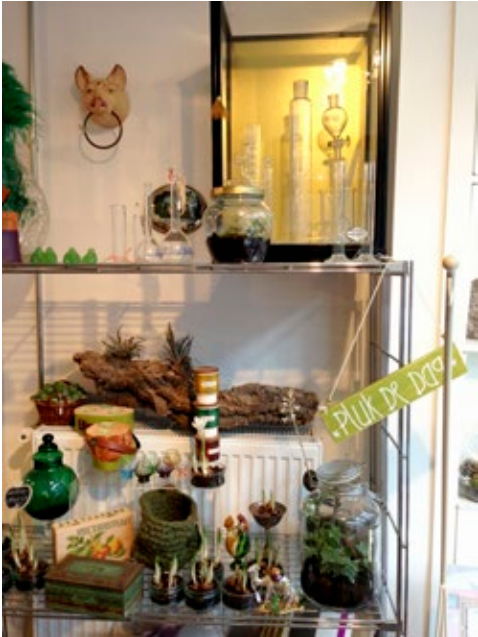
De toonbank en het logo van Pim Coffee is ontworpen door het Haagse ontwerpbureau In De Vorm Van. Boven: Maison Indochine en Wauw