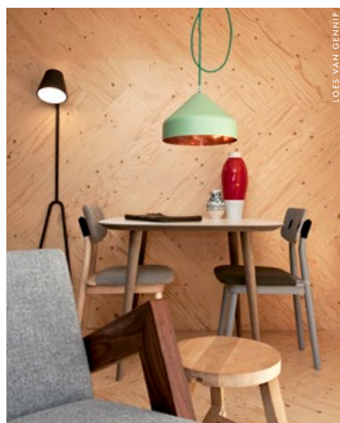
Bij Edwin Pelsler koop je objecten met een verhaal

Ongeveer twee kilometer van het centrum van Den Haag ligt een van de oudste stadswijken: het Zeeheldenkwartier. In de straten en hofjes met namen van beroemde zeebonken, wisselen statige oude herenhuizen en kleine arbeiderswoningen elkaar af. Onder Haagse studenten en kunstenaars zijn het de meest gewilde straten om te wonen. Dat is te begrijpen, want in het Zeeheldenkwartier hangt een heel eigen sfeertje. Sinds creatieve ondernemers met een neus voor the right time en the right place zich er vestigden, is de buurt enorm in opkomst en vind je er onalldaagse designwinkels en koffiebars tussen de bruine cafés, wasserettes, Indiase toko's, een Cous Cous Lounge, antiquairs, brocantes en andere tweedehandszaken. Juist die mix is zo inspirerend. Niet te gepolijst, niet te bedacht.