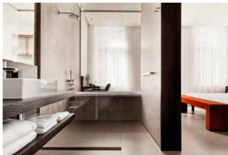
Boven Restaurant Witloof, onlangs gerestyled door Maurice Mentjens Links Minimalisme in Hotel Beaumont Rechts De vijftiende eeuw en futuristisch design komen samen in het Kruisherhotel