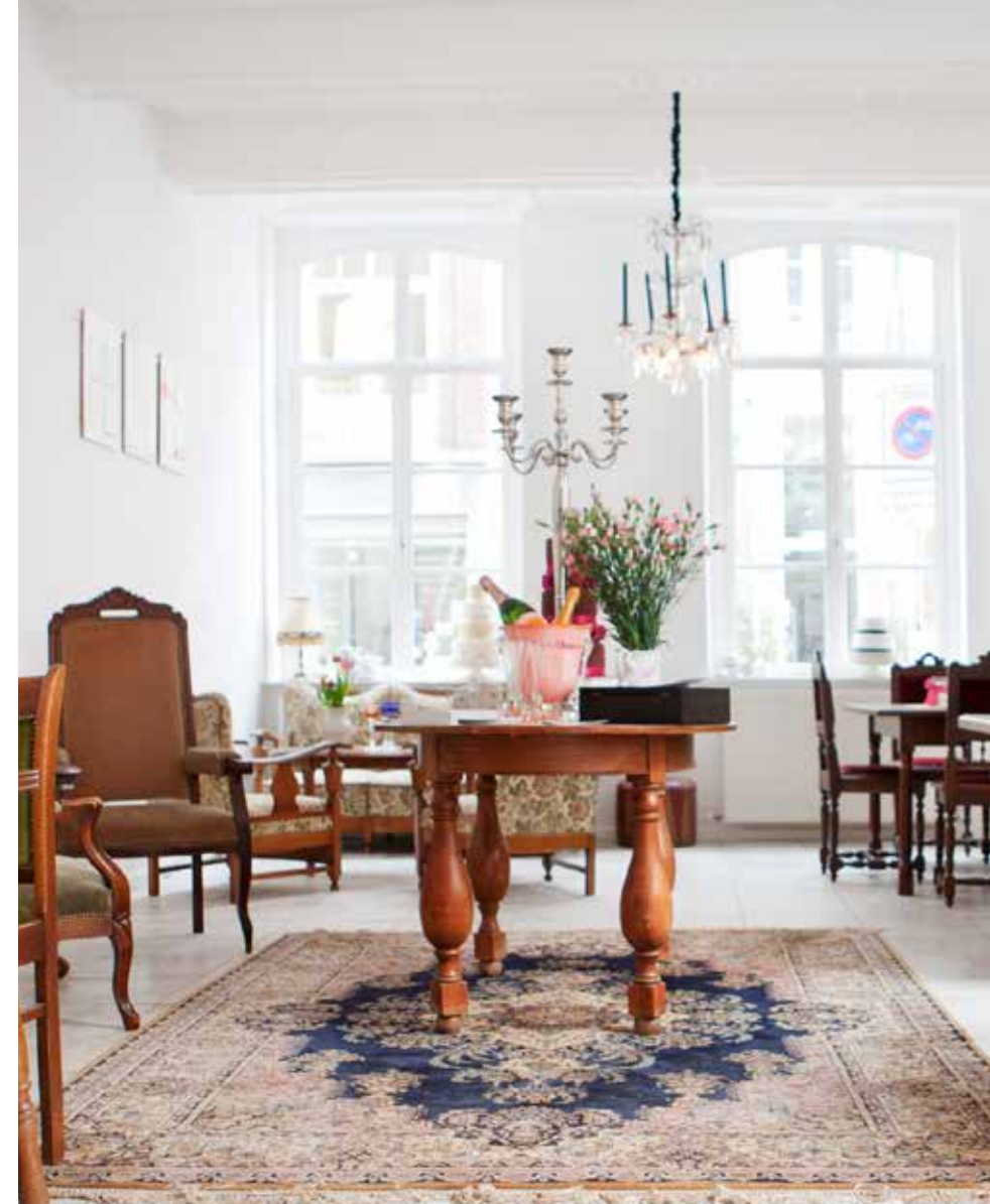
Ontbijten en taart eten doe je in Maastricht bij Taartzaak

Witloof Ieder interieurblad (wij ook) schreef over dit restaurant toen het in 2006 geopend werd. Nu ontwerper Maurice Mentjens het onlangs heeft gerestyled heb je een goede reden om er opnieuw naartoe te gaan. België is de inspiratiebron gebleven, ook op de menukaart, je waant je er in de boulangerie en beenhouwerij van weleer.